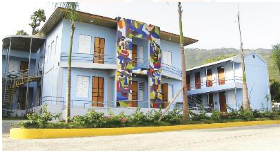
Le Centre bénéficie d'un soutien de la Fondation Smithsonian, la fresque est l'œuvre du peintre haïtien Joseph Eddy PIERRE