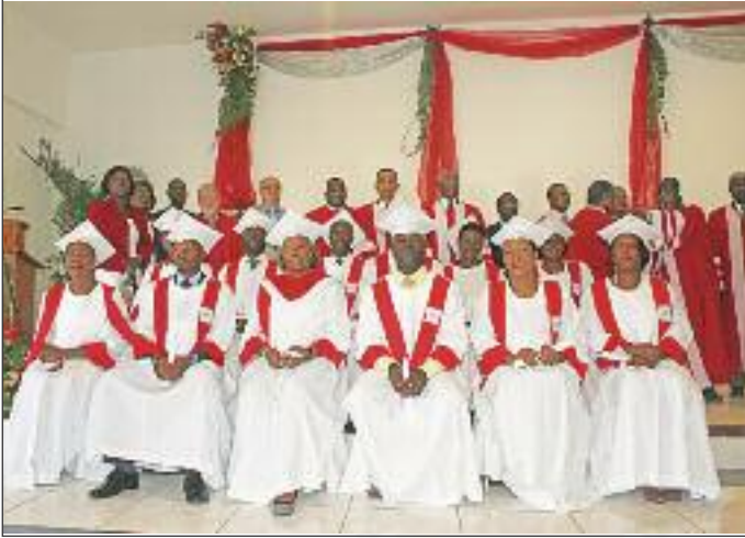
Cérémonie de graduation 2012