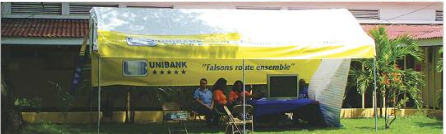
Sur le campus de la rue Charéron