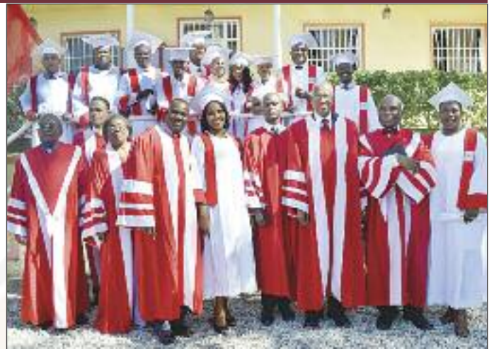
Cérémonie de graduation 2014