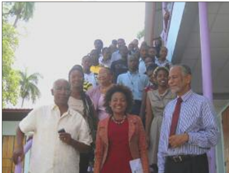
Accueil par le Recteur en 2011 de Madame Michaëlle JEAN, aujourd'hui Secrétaire Générale de la Francophonie